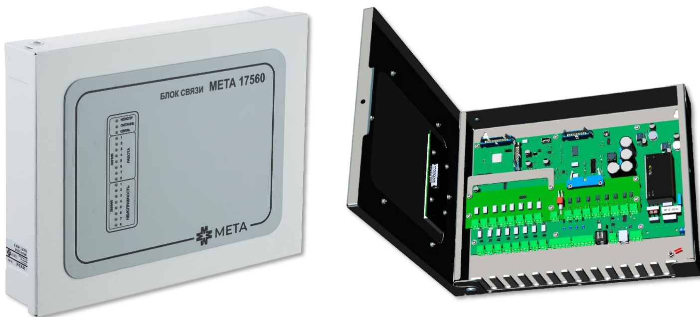
Рисунок 1. Внешний вид БС МЕТА 17560.

Примечание: «*» – до 300м при использовании кабеля UTP CAT 5E, до 600м при использовании кабелей типа КСБнг(А)-FRLS/FRHF Nx2x0,64, КИС-РВнг(А)-FRLS Nx2x0,64, КИС-РПнг(А)-FRHF Nx2x0,64 или кабелей для промышленного интерфейса RS-485 с аналогичными характеристиками.